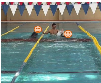
ゴール! コーチとハイタッチ