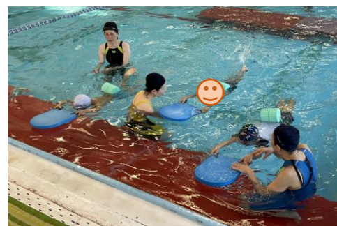
腕を伸ばしてビート板キック!