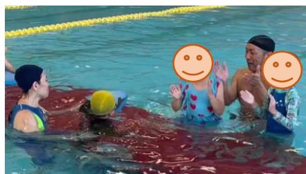
仲間がゴールするまで応援!