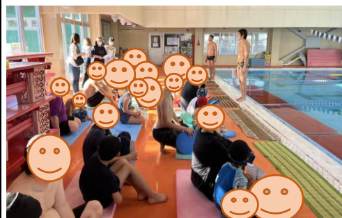
いよいよ発表会がスタート!

2023年12月23日(土)、第4回スイミング発表会を実施いたしました。当日は22名のお子さん(アイラック(さがみ野)11名、アイラックやまと4名、Swimming&Wellness IROHA7名)が参加してくださいました。目標は、①自分の思う「出来るようになって嬉しいこと」をみんなの前で自信をもって発表しよう!②たくさんの拍手をもらって、幸せな気持ちになろう!の2つ。観覧席にも大勢の方に来ていただき、発表会はスタートしました。