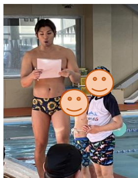
一人一人、コメントと共に紹介!