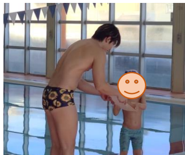
表彰式・1人で前へ!