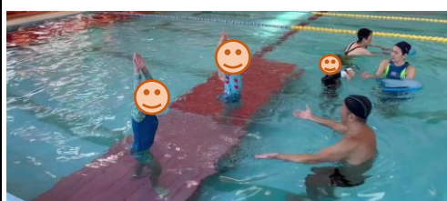
腕を伸ばして～さあ行くぞ!