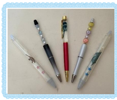
ボールペン・シャープペン