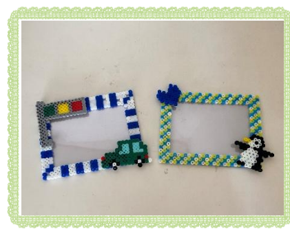
アイロンビーズフォトフレーム